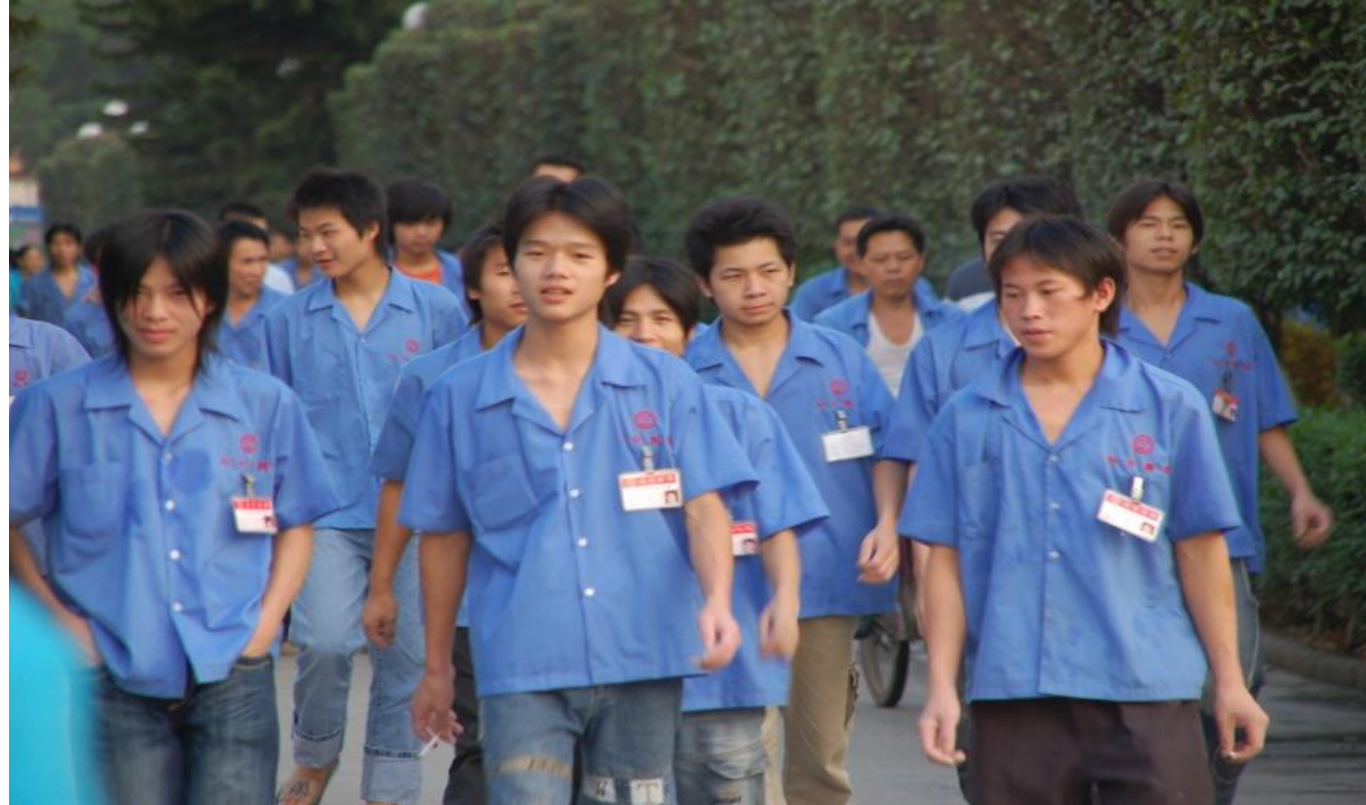
Plate 3.2 Migrant workers in Yantian