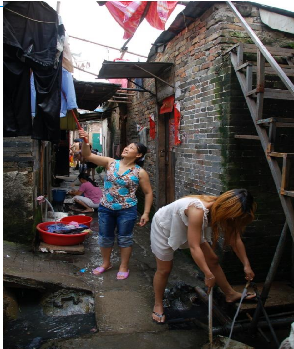
Plate 5.1 From the late-eighties, many Yantian villagers started renting out their houses to migrant workers