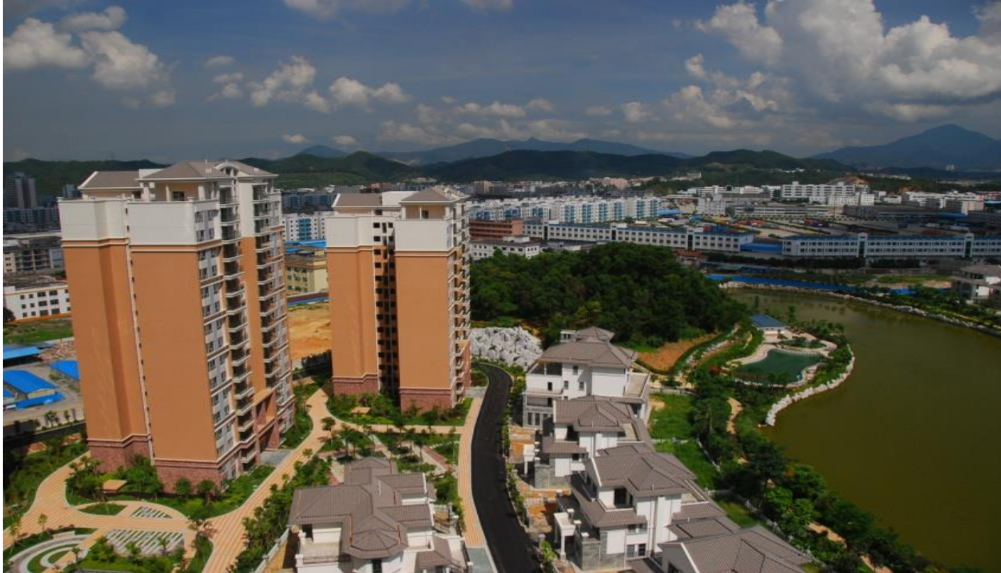
Plate 4.3 Cuihu Luxury Garden, Yantian