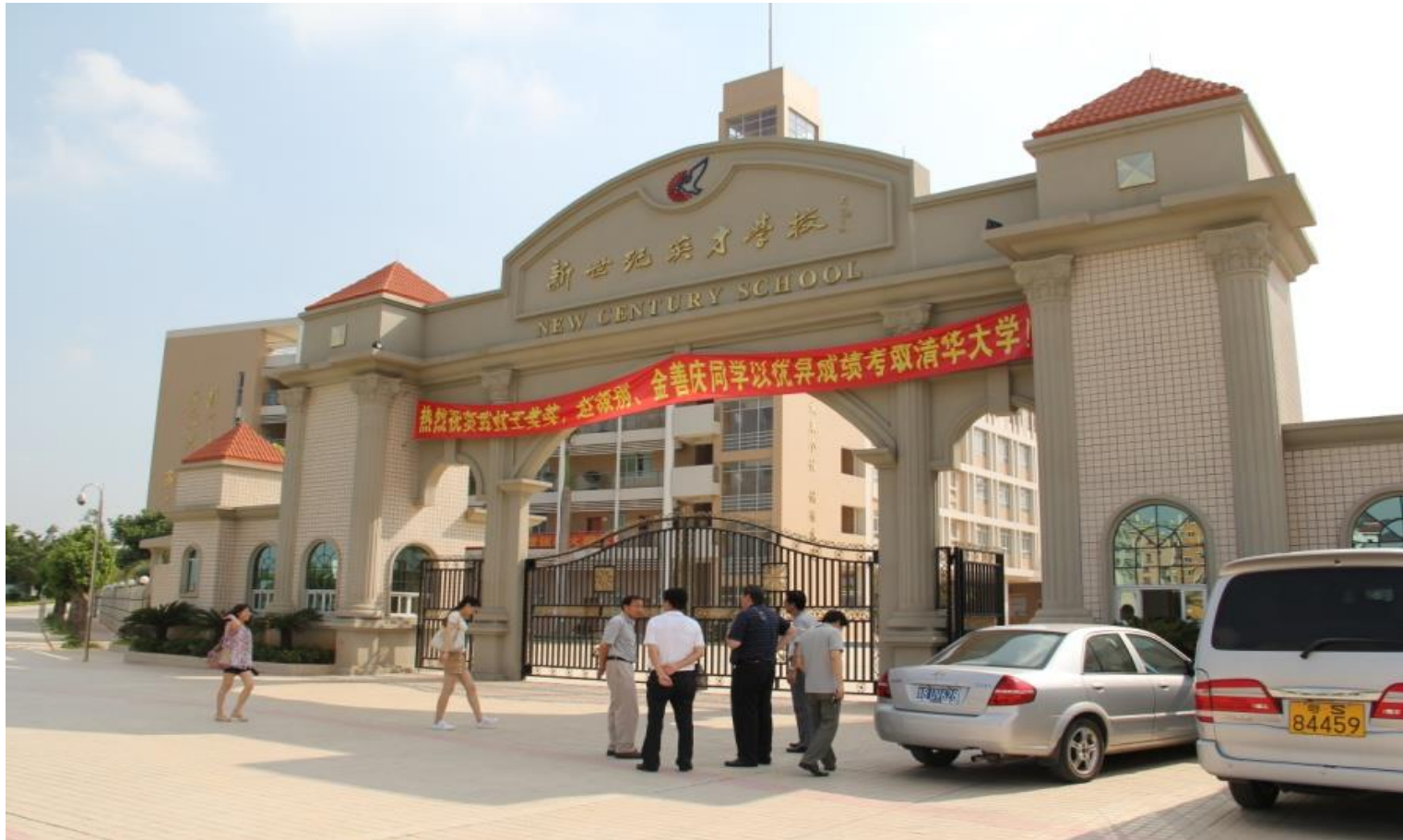
Plate 6.4 The private New Century Talents School