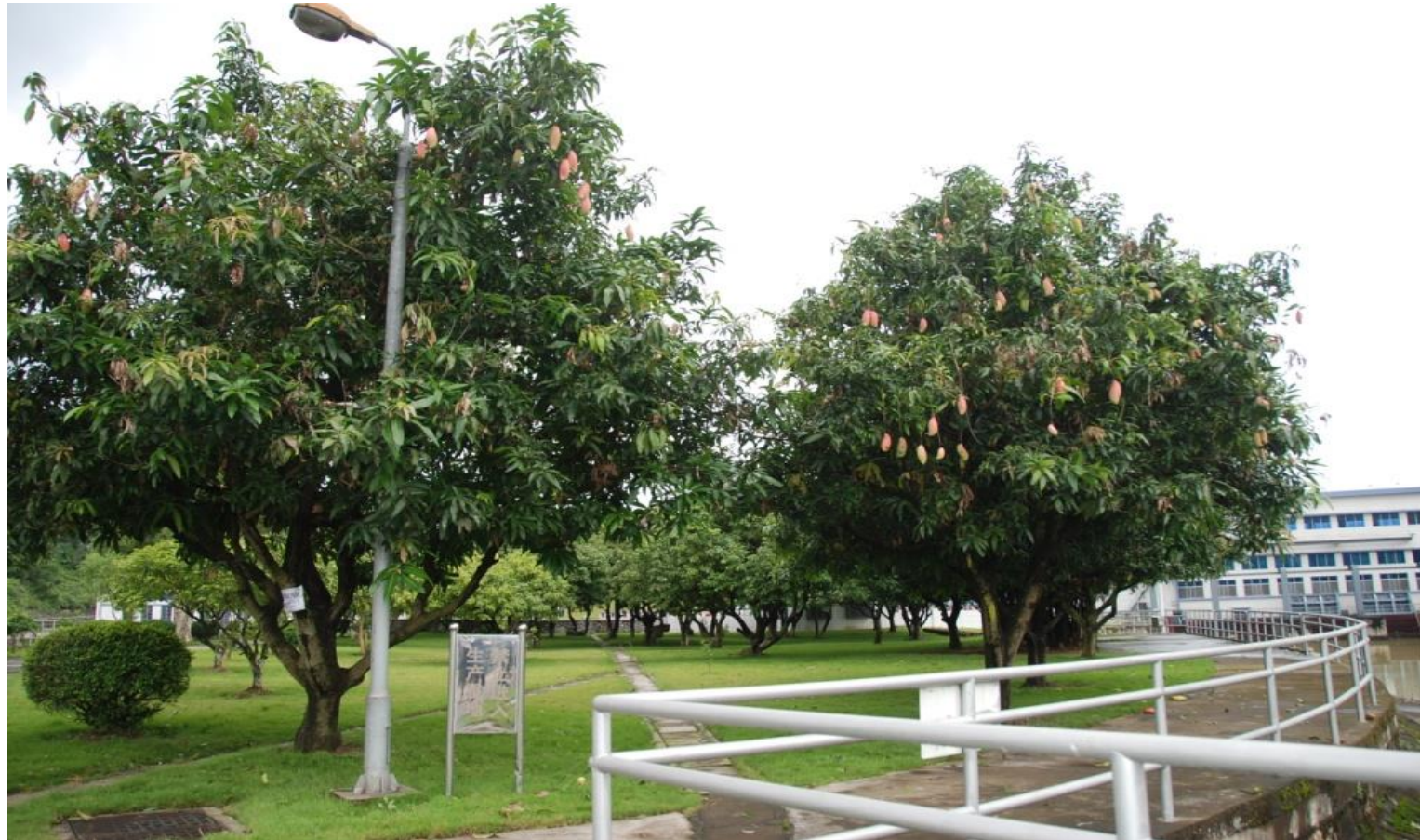
Plate 2.2 Yantian villagers use contracted land to plant fruit trees