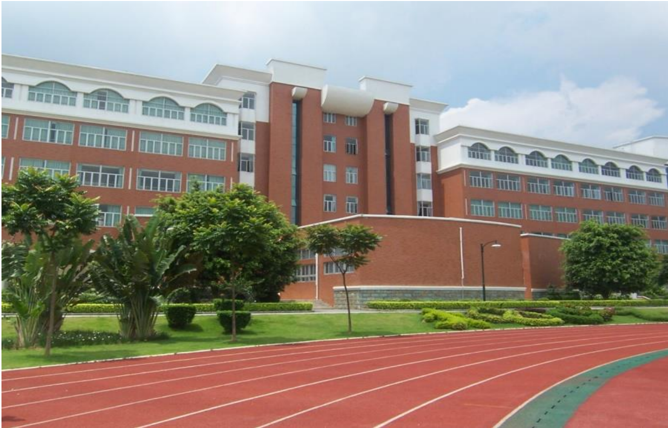
Plate 6.2 The Zhentian School was initially founded as a collective-run school but is now government-run