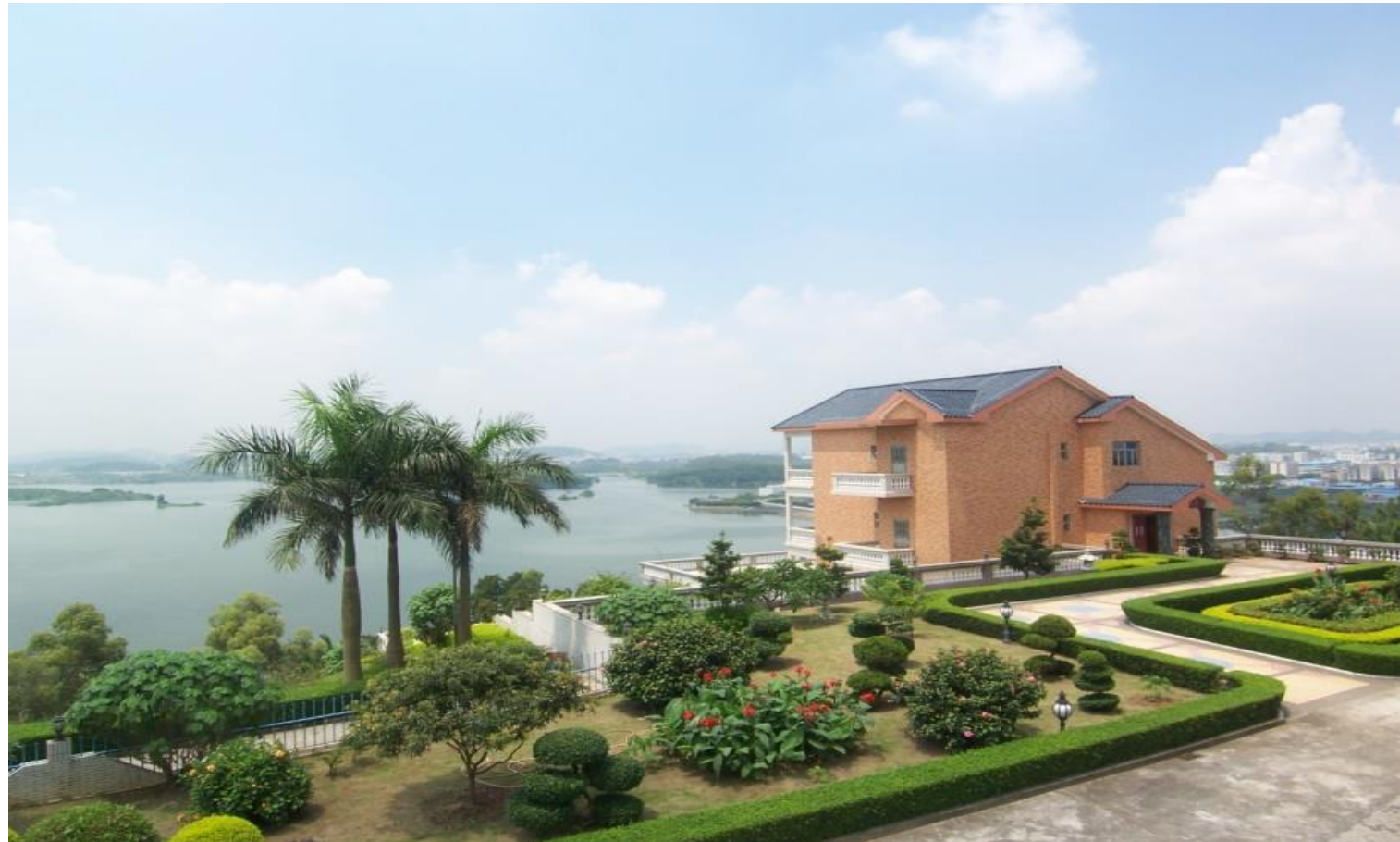
Plate 5.3 Some villagers have become very wealthy...