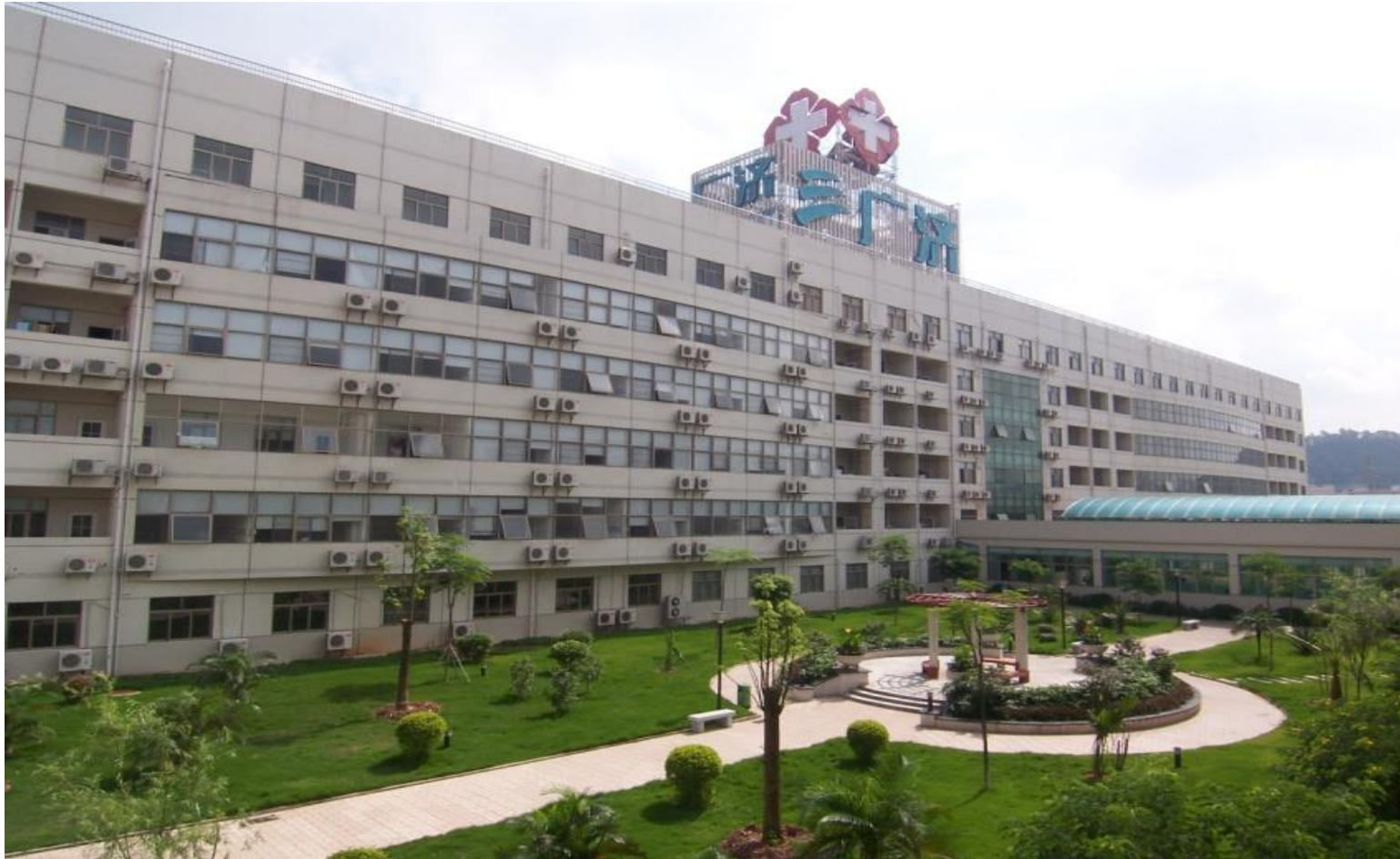
Plate 7.1 The privately-run Guangji Hospital