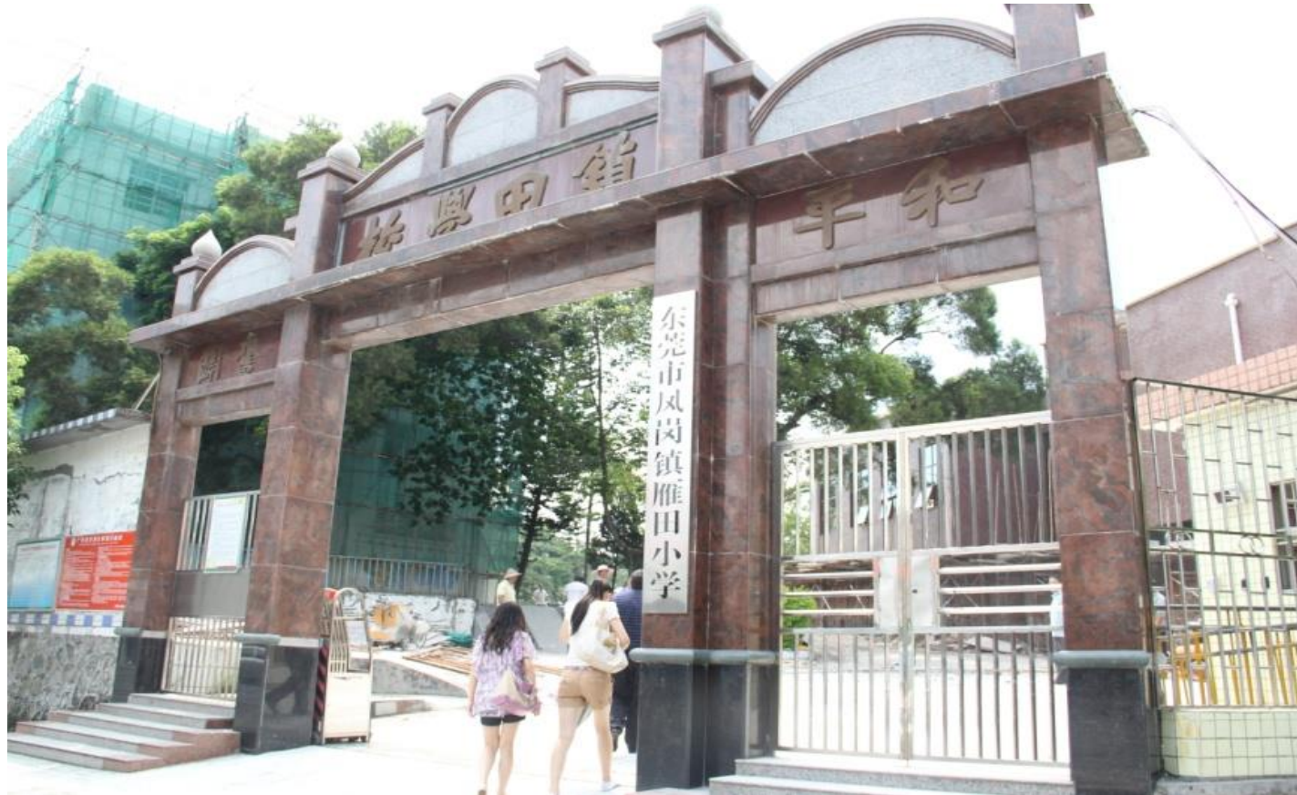
Plate 6.1 The original Zhentian School (latterly Yantian Elementary School) is now a specialized elementary school for the children of migrant workers (Photo by Zhou Guangming, 2011)