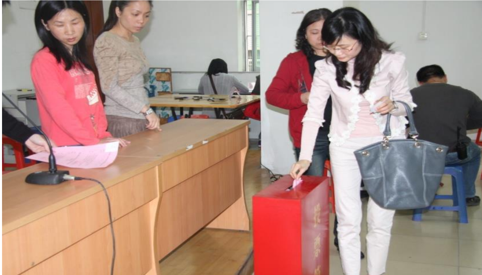
Plate 8.2 A Dong'er villager votes for the new village committee members, April 4, 2011