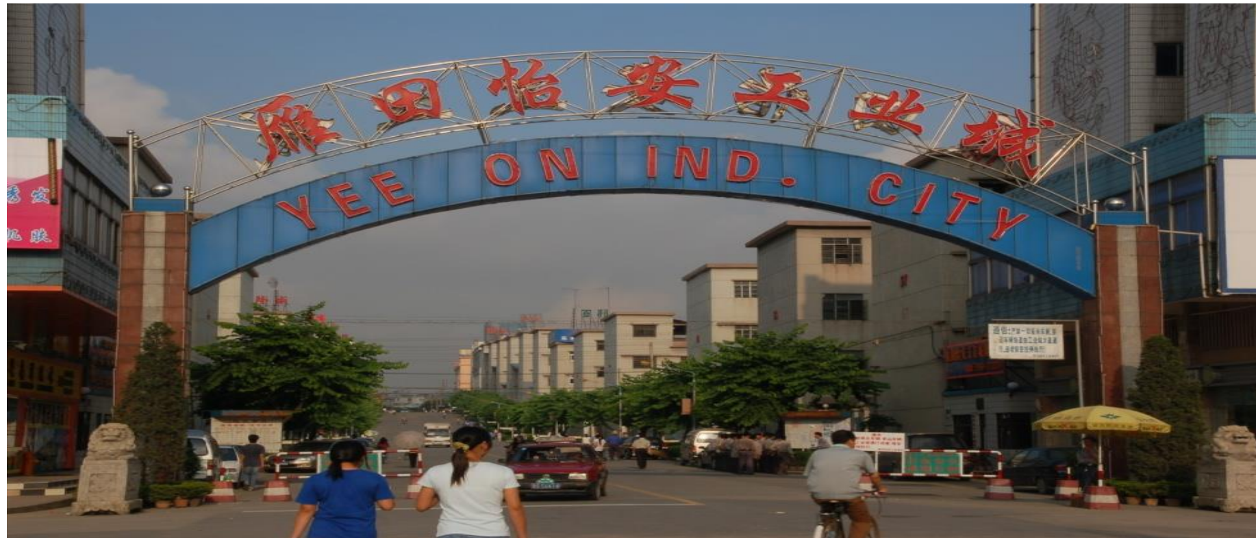
Plate 4.2 Early industrial district in Yantian (Photo by Li Yuxiang, 2006)