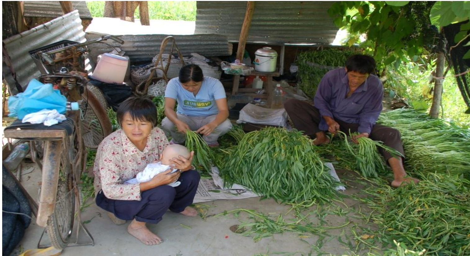
Plate 2.3 Migrant workers who have contracted land to grow vegetables