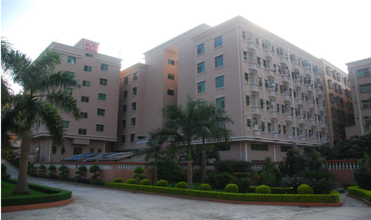
Plate 5.2: Rentals have become increasingly important to the household economy