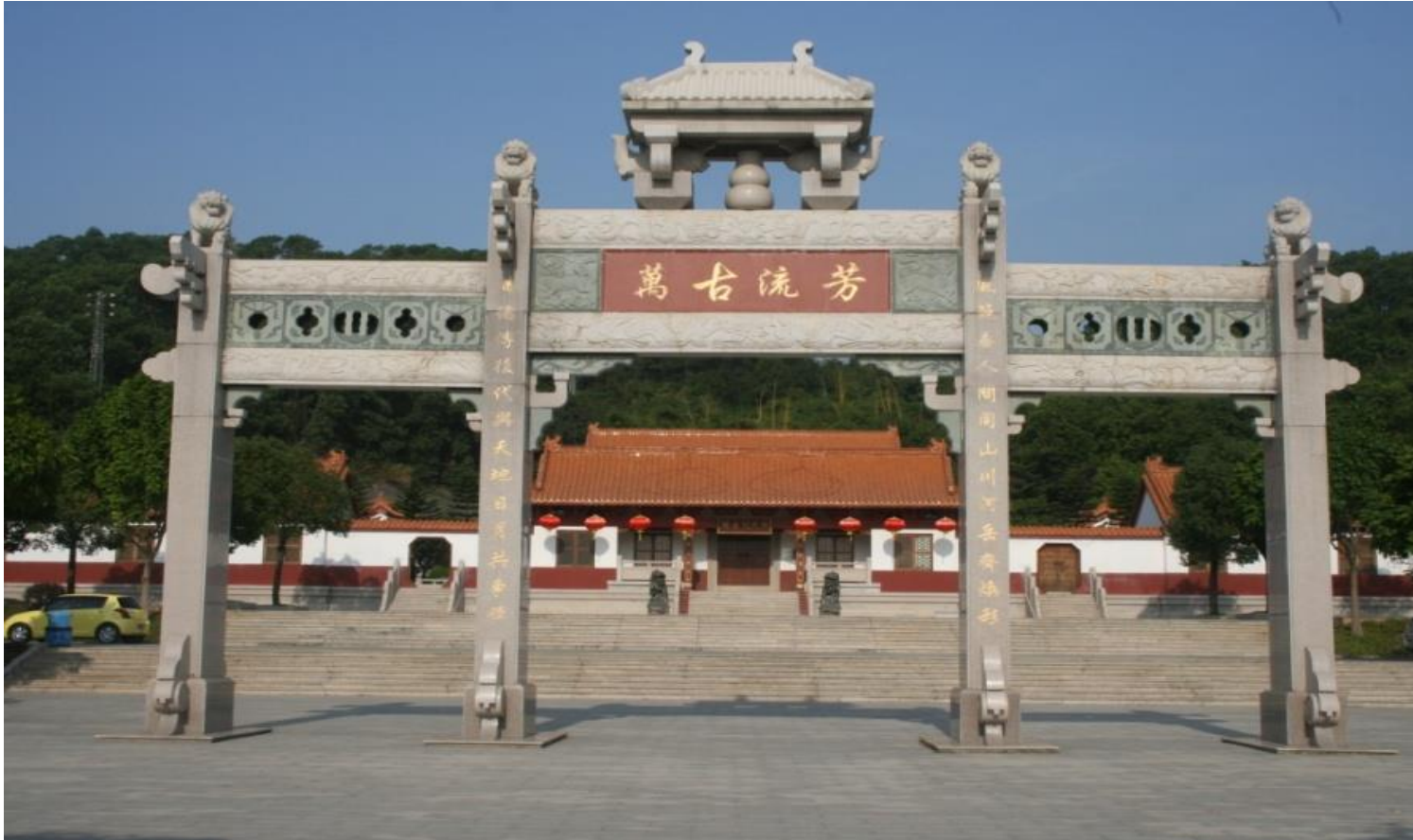
Figure 1.3 Deng Memorial Hall in Yantian