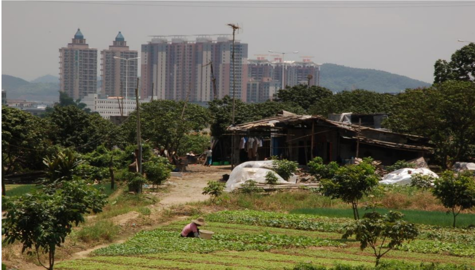
Plate 2.1 From the early eighties agriculture has been in decline (Photo by Li Yuxiang, 2006)