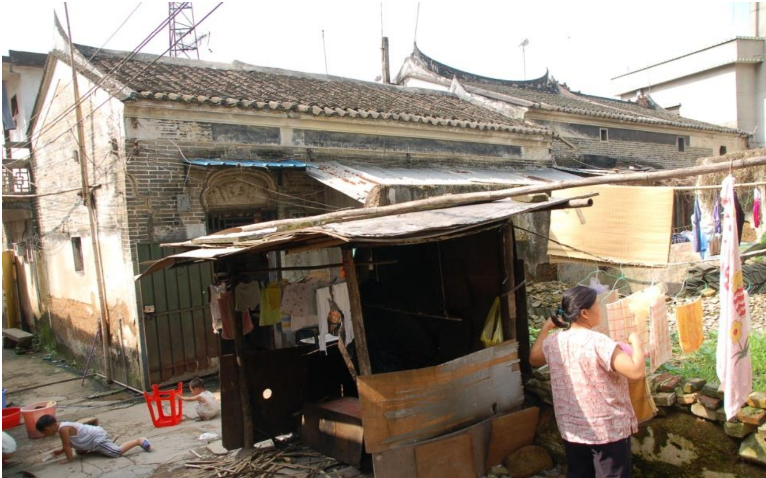
Plate 5.4 ... but some remain relatively poor (Photo by Li Yuxiang, 2006)