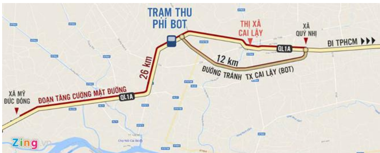
Hình 1: Trạm thu phí BOT và đường tránh thị xã Cai Lậy

Có nhiều quan điểm và sự nhìn nhận khác nhau về câu chuyện này, nhưng sự bức xúc của dư luận tập trung ở việc trạm thu phí lại đặt ở điểm mà cả xe đi đường tránh và đường hiện hữu đều phải trả phí, trong khi công bằng là chỉ được thu phí đường tránh mà thôi. Một số tờ báo điện tử đã thực hiện các cuộc thăm dò dư luận và tuyệt đại đa số đều chọn phương án là dời trạm thu phí vào đường tránh.