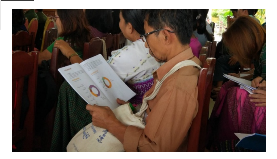
ပြည်သူထံ သတင်းအချက်အလက် များ သိရှိနိုင်ရန် ထုတ်ပြန်ပေးခြင်း၊ ပြည်သူထံမှ အကြံပြုချက်သဘော ထားများကို ပြန်လည်ရယူခြင်း အပြန်အလှန် နည်းလမ်းနှစ်သွယ်က ပြည်သူ့ရေးရာကဏ္ဍ စီမံခန့်ခွဲမှု အရည်အသွေးကို တိုးတက်လာ စေမည်ဖြစ်ပါသည်။

မှရရှိသည့် အကျိုးကျေးဇူးများကို အကောင်းဆုံး သီးပွင့်စေမည်ဖြစ်ပါသည်။ သို့ဖြစ်ရာ ပွင့်လင်းမြင်သာ၍ အစိုးရ၏ ဘဏ္ဍာရေးဆိုင်ရာသတင်းအချက်အလက်များကို ထုတ်ပြန်ရုံ သာမကဘဲ အများပြည်သူပါဝင်ခွင့်ရှိမှု၊ ဘတ်ဂျက်တွင် ပါဝင်သည့် ဌာနဆိုင်ရာ အဖွဲ့အစည်း များ၏ တာဝန်ယူတာဝန်ခံမှု၊ ပြည့်မီရမည့် ပွင့်လင်းမြင်သာမှုဆိုင်ရာစံလုပ်ငန်းစဉ်များကို တပြေးညီ ချမှတ်လုပ်ဆောင်နိုင်စေသည့် အချက်များကိုလည်း စနစ်တကျ မူဘောင်သွင်း လုပ်ဆောင်ရမည်ဖြစ်ပါသည်။